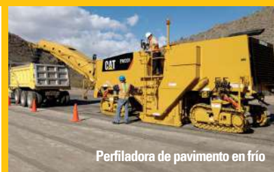
Perfiladora de pavimento en frío

HABLAR DE TRITURACIÓN ES HABLAR DE METSO