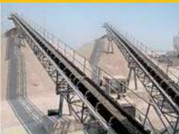
Bandas y Accesorios para transportadores