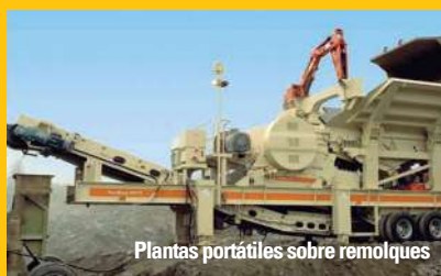
Plantas portátiles sobre remolques