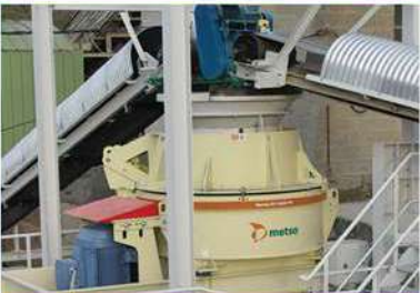
Trituradoras de impacto vertical