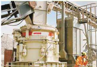
Trituradoras de cono