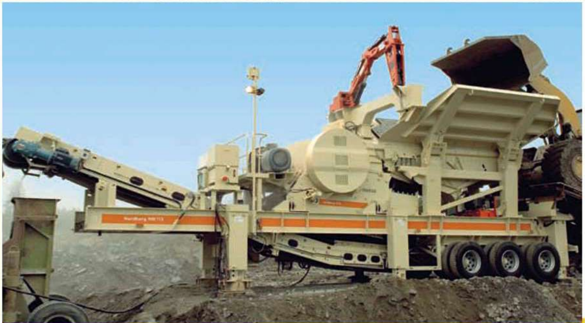
Plantas portátiles sobre remolques