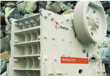
Trituradoras de quijada