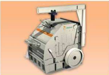
Trituradoras de impacto horizontal